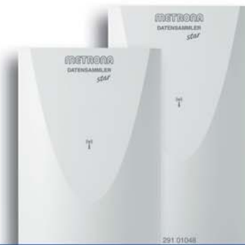
METRONA DATENSAMMLER star