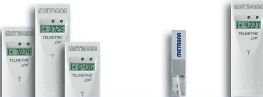
Heizkostenverteiler METRONA TELMETRIC star