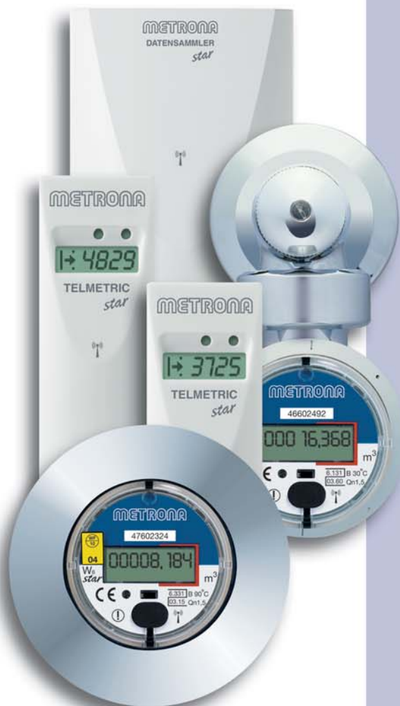
Das neue METRONA FUNKSYSTEM star